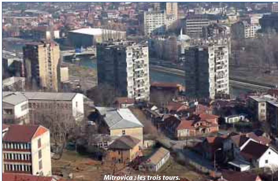
Mitrovica : les trois tours.

In fact those rules allow a lot of things. For example,