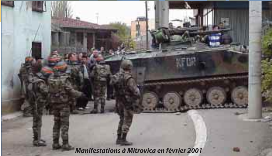
Manifestations à Mitrovica en février 2001

internationale ou d'un magistrat. Ainsi, en janvier 2000, des tirs d'AK47 provenant des "trois tours" situées près du pont Ouest avaient provoqué un jour des fouilles dans l'immeuble. Comme par hasard, l'appartement d'où étaient partis les tirs était fermé à clé. Les soldats n'avaient pas enfoncé la porte. Suite à de nouveaux tirs le lendemain, il y eut une nouvelle fouille. La porte enfoncée, les soldats de la KFOR trouvèrent plusieurs armes, grenades et pas moins de sept mille cartouches de 7,62... et ce, dans le plus strict respect des textes.