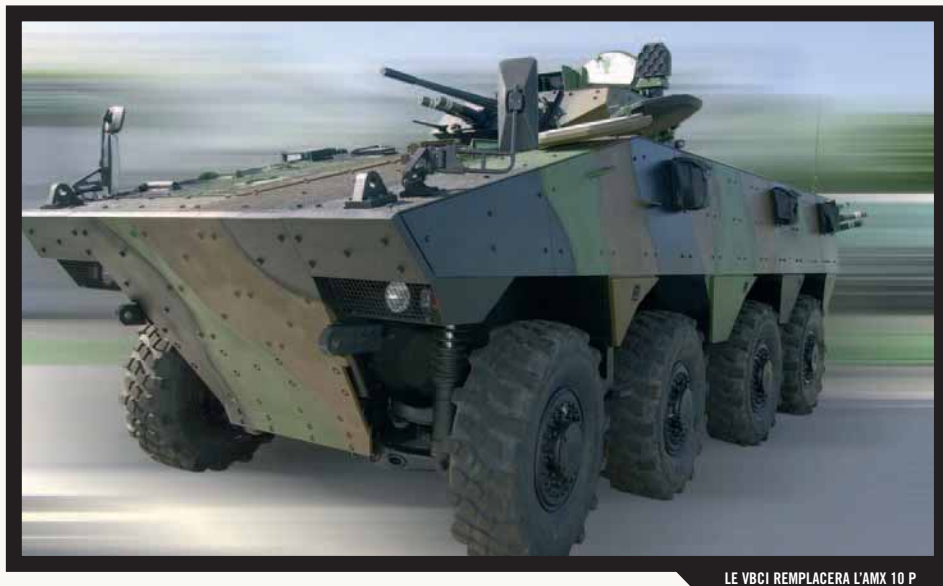
LE VBCI REMPLACERA L'AMX 10 P

Dans ce domaine, l'année 2008 ne constitue pas à proprement parler une date charnière en terme de capacités pour l'infanterie. Les fantassins verront cependant entrer en service les premiers exemplaires des programmes majeurs qui concernent directement le combat débarqué et qui, une fois maîtrisés et déployés en opérations, donneront aux unités une capacité de combat supérieure.