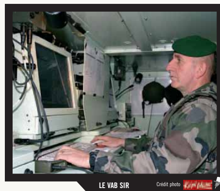
LE VAB SIR

L'autre grand sujet d'étude porte sur la politique générale d'équipement de l'infanterie. Pour cette étude, trois paramètres sont à prendre en compte : le vieillissement de nos parcs de véhicules aux opérations de maintenance toujours plus lourdes, des livraisons de matériels modernes échelonnées dans le temps et des besoins nouveaux constatés en opération ou déduits d'évaluations tactiques. Dans le même temps, les unités devraient continuer à être fortement sollicitées par les opérations extérieures. En dehors d'un improbable effort financier supplémentaire, il faut donc concevoir une politique d'équipement audacieuse qui permette à tous les fantassins de s'instruire, de s'entraîner et de partir en opérations avec les matériels les plus